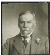
Frederik van Eeden

Riječ je o nizozemskom psihijatru i piscu, Frederiku Willemu van Eedenu, koji je koncem 19. stoljeća započeo s istraživanjem snova. Obzirom da su LaBerg, a i svi ostali prve korake u istraživanju činili po tragovima i ovog čovjeka, zainteresiralo me je, što je on ostavio za sobom.